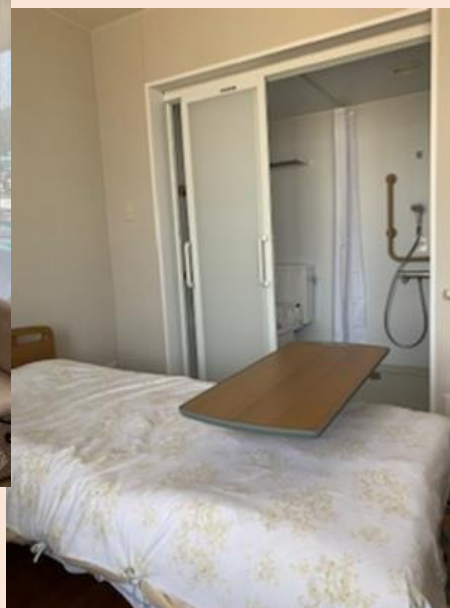
シャワー付き個室